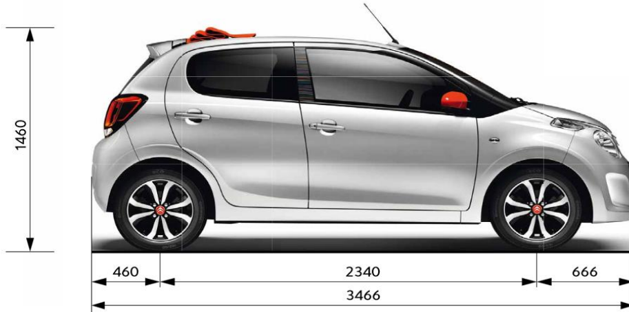
Maße in mm